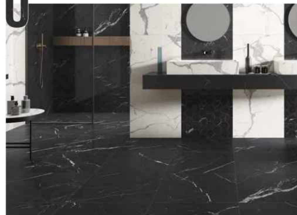
U nique Black