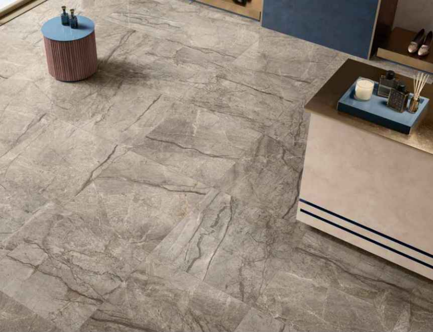
Floor: AMAZING SILVER 80x80 LUCIDATO RT Furniture by C.Los: PINK ONYX 120x278 LUCIDATO RT

Un'articolata trama di venature che variano dall'antracite al bronzo: Amazing Silver si contraddistingue per la sua nobile eleganza.