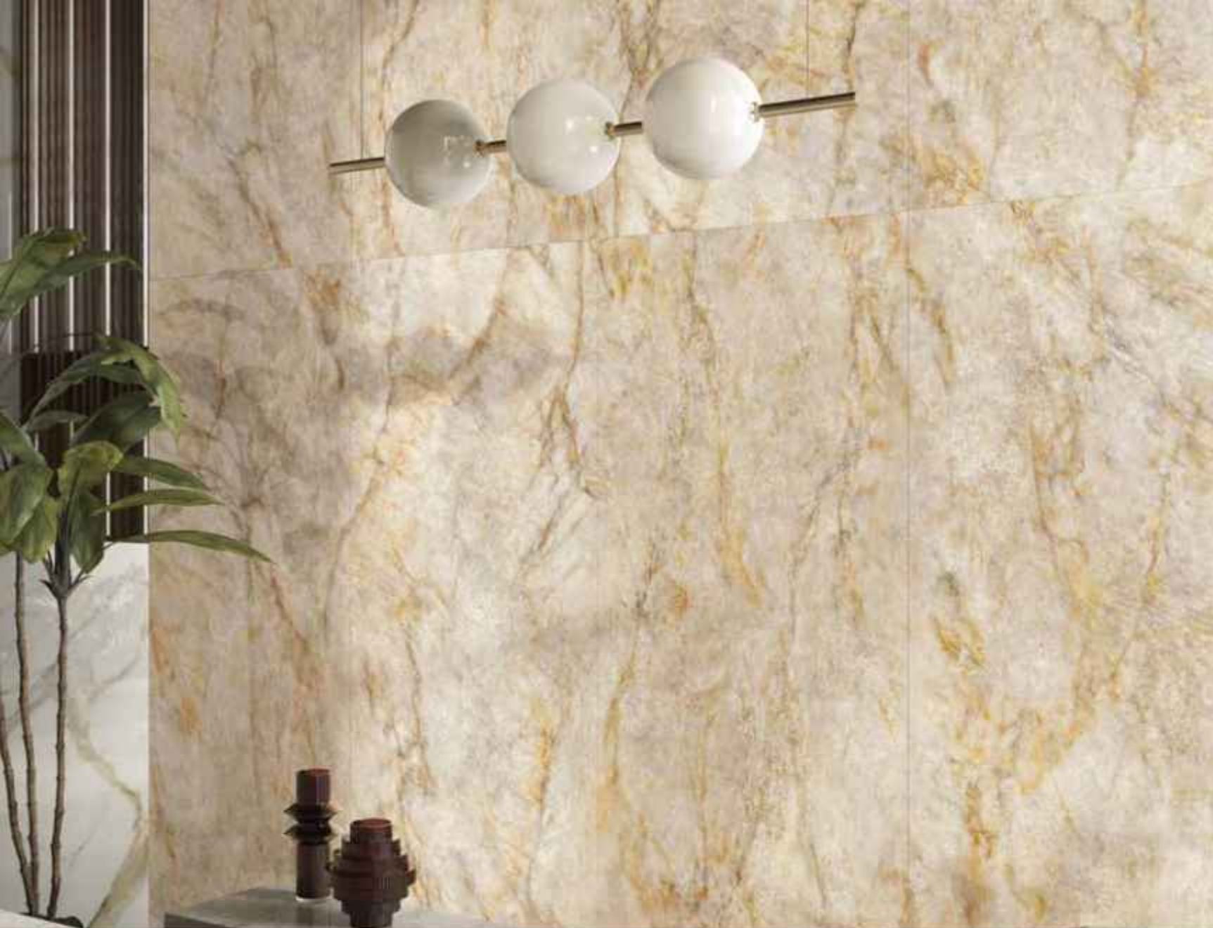
Wall: CRYSTAL DELIGHT 120x278 LUCIDATO RT Furniture by C.Los: AMAZING SILVER 120x278 LUCIDATO RT

Crystal Delight conquista l'occhio con la sua forza scenica. La sua elegante variabilità cromatica sfocia in accenti dorati.