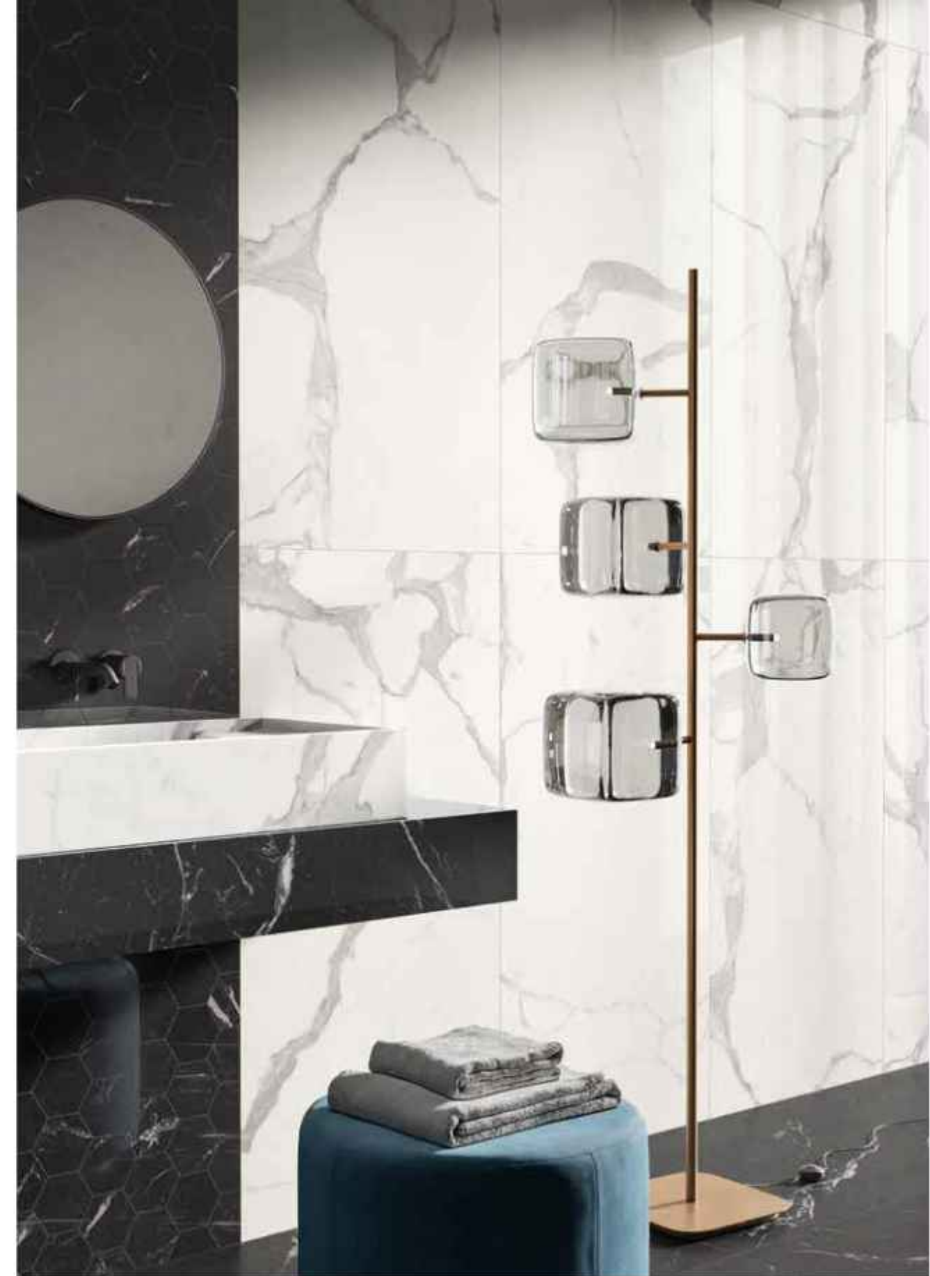
Floor: UNIQUE BLACK 60x60 MATT RT R9 Wall: MAJESTIC WHITE 60x120 LUCIDATO RT, UNIQUE BLACK COMPOSIZIONE ESAGONO 28,5x33 LUCIDATO RT Furniture by C.Los: UNIQUE BLACK 120x278 LUCIDATO RT, MAJESTIC WHITE 120x278 LUCIDATO RT

Feine weiße Äderungen heben sich von tiefschwarzem Grund ab: Die Kontraste von Unique Black verbinden sich zu einem reinen, kontemporären Gleichgewicht.