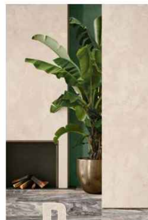
P ink Onyx