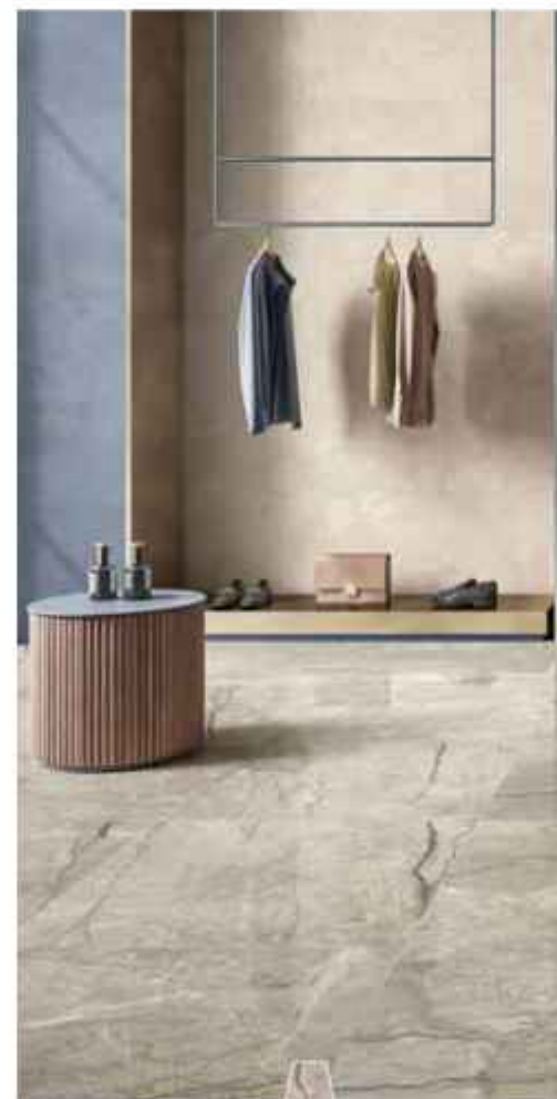
A mazing Silver