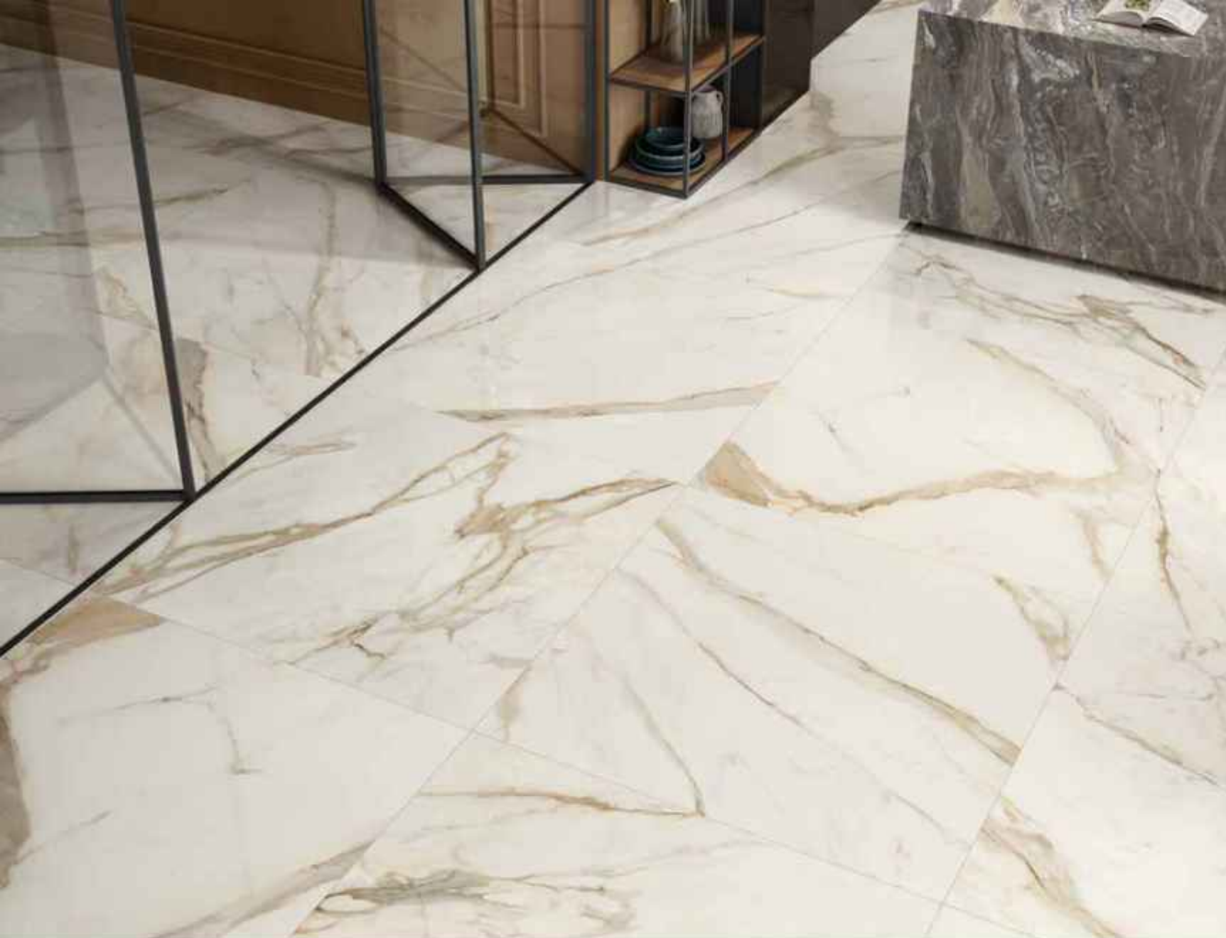
Floor: GOLDEN WHITE 120x120 LUCIDATO RT Furniture by C.Los: CRYSTAL DELIGHT 120x278 LUCIDATO RT

Golden White è calda e sinuosa armonia, con le sue vene che partono dal grigio e raggiungono suggestive sfumature dorate.