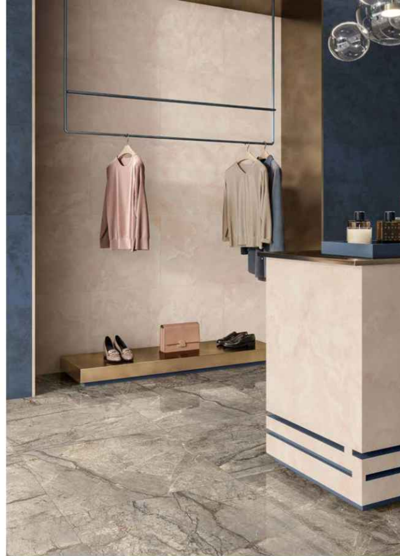
Floor: AMAZING SILVER 80x80 LUCIDATO RT Wall: PINK ONYX 60x120 LUCIDATO RT, JOIN INK 60x120 SOFT RT

Ein komplexes Geflecht aus Äderungen, die von Anthrazit bis Bronze variieren: Amazing Silver zeichnet sich durch noble Eleganz aus.