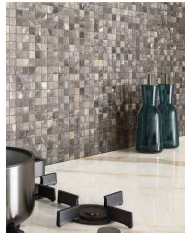
KEEN GREY COMPOSIZIONE F 30x30 cm - 11 15 / 16 "x 11 15 / 16 " LUCIDATO RT