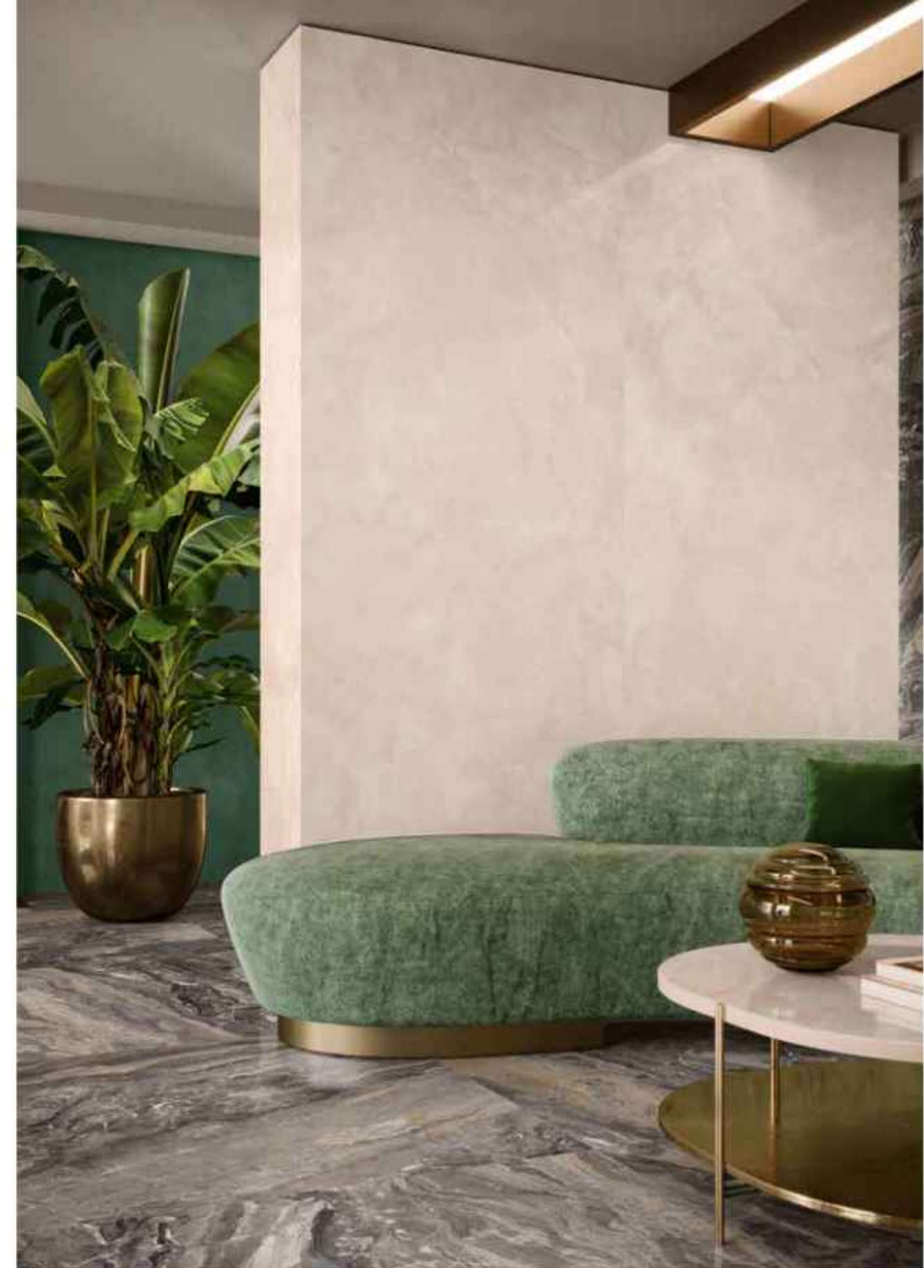
Floor: KEEN GREY 120x120 LUCIDATO RT Wall: PINK ONYX 120x278 LUCIDATO RT

Насыщенные цвета плитки Keen Grey напоминают рисунок осадочных пород, варьируясь от оттенков серого до теплых бежевых.