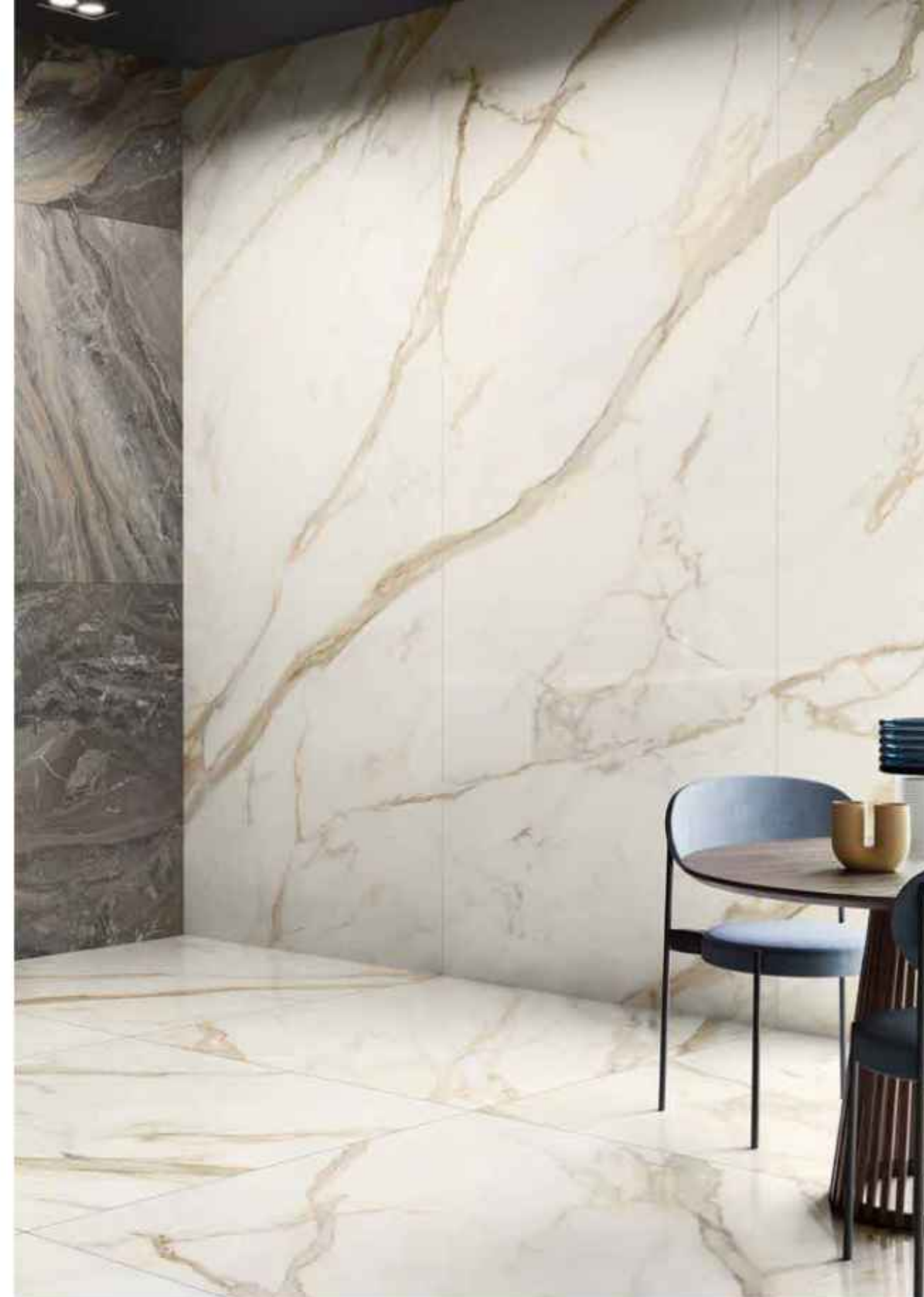
Floor: GOLDEN WHITE 120x120 LUCIDATO RT Wall: CRYSTAL DELIGHT 60x120 LUCIDATO RT, GOLDEN WHITE 120x278 LUCIDATO RT

Golden White ist warme und fließende Harmonie, mit Äderungen, die von Grau ausgehend eindrucksvolle Goldnuancen erreichen.