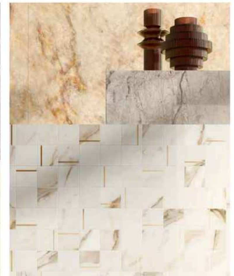
GOLDEN WHITE COMPOSIZIONE N BRASS 30x30 cm - 11 15 / 16 "x 11 15 / 16 " LUCIDATO RT