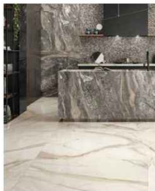
E ldon White