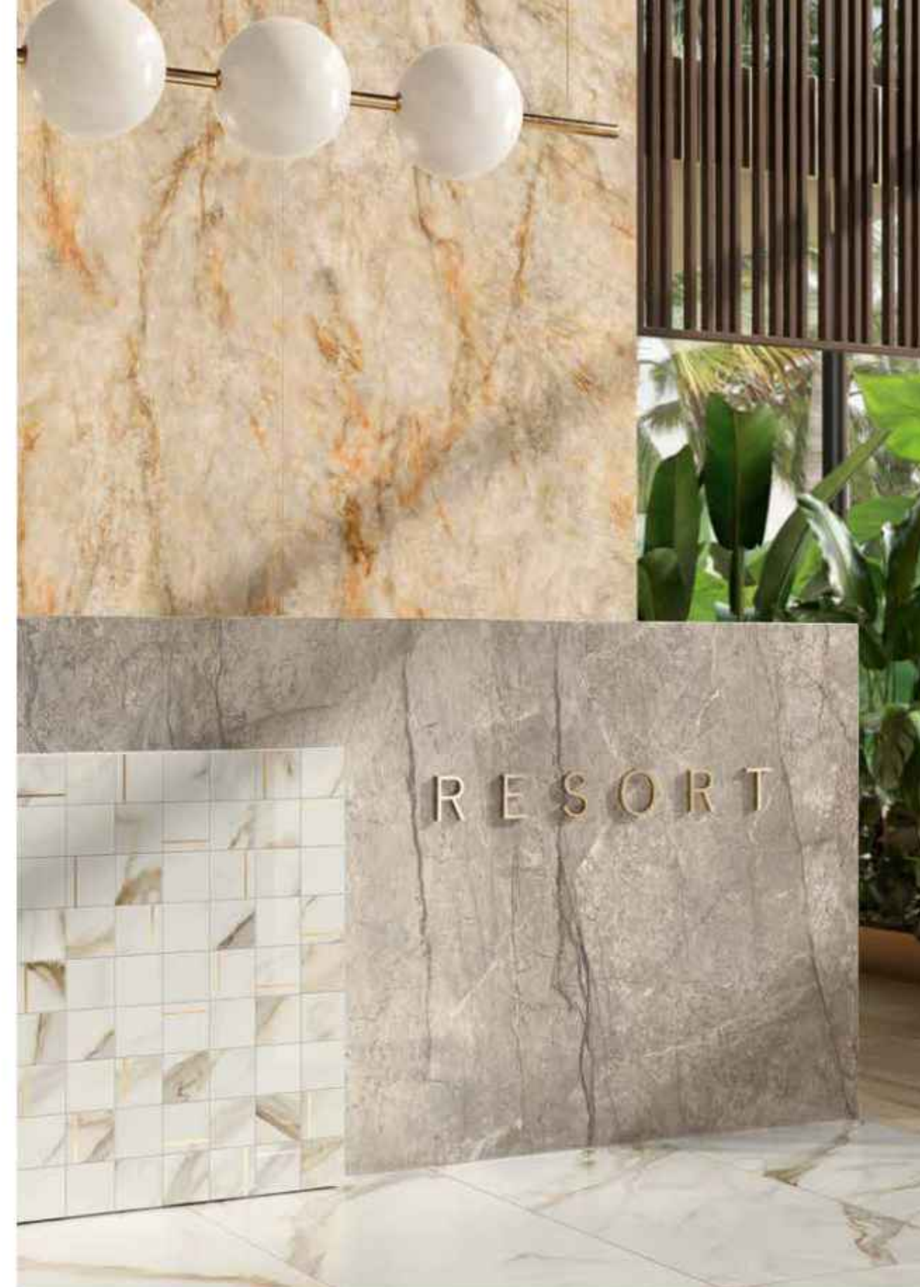
Floor: GOLDEN WHITE 60x120 MATT RT R9, MEET CHIC BEIGE 20x120 MATT RT R9 Wall: CRYSTAL DELIGHT 120x278 LUCIDATO RT, GOLDEN WHITE 120x278 LUCIDATO RT Furniture by C.Los: AMAZING SILVER 120x278 LUCIDATO RT, GOLDEN WHITE COMPOSIZIONE N BRASS 30x30 LUCIDATO RT

Crystal Delight besticht mit szenischer Kraft und der eleganten, in Goldakzente mündenden Farbvariabilität.