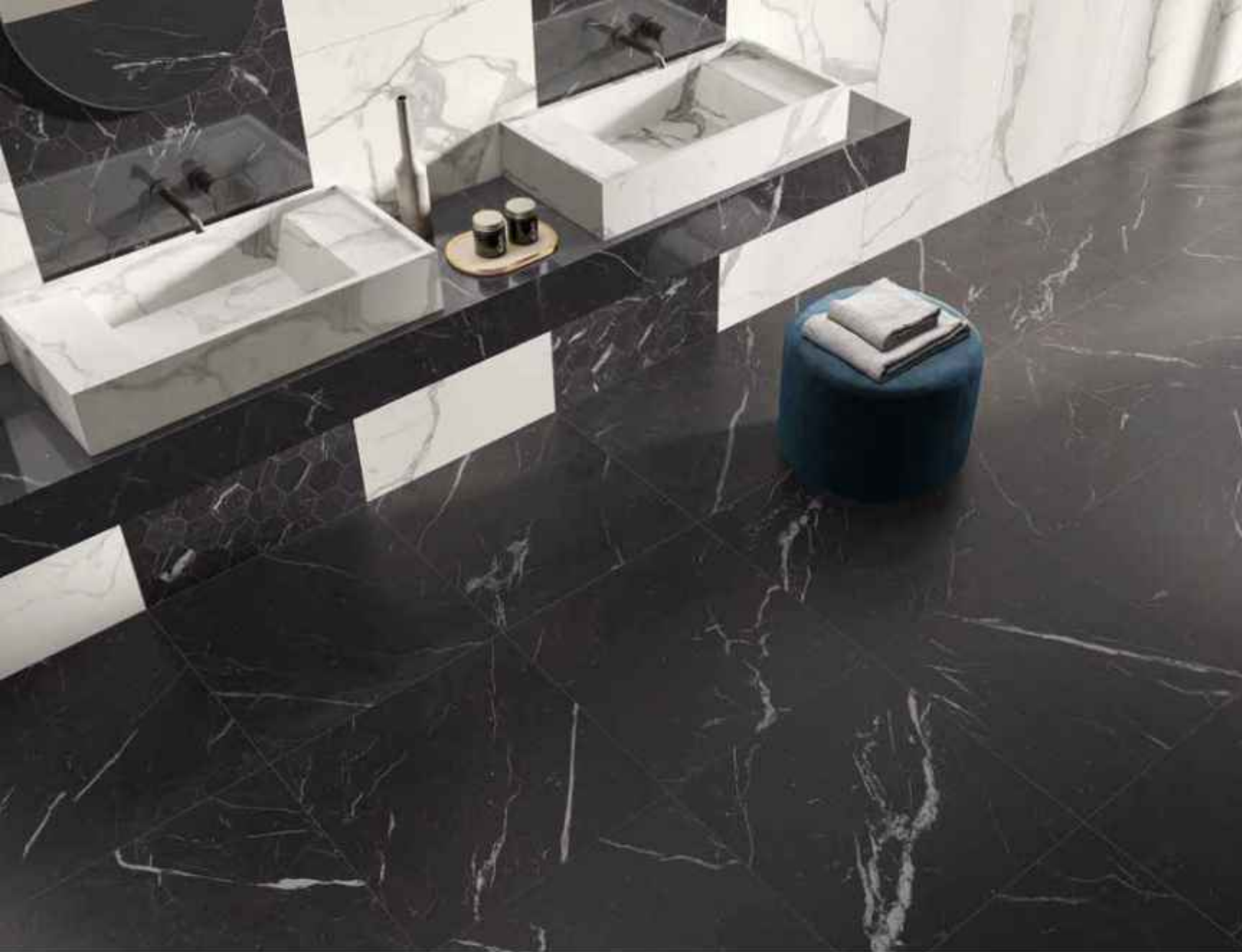
Floor: UNIQUE BLACK 60x60 MATT RT R9 Wall: MAJESTIC WHITE 60x120 LUCIDATO RT, UNIQUE BLACK COMPOSIZIONE ESAGONO 28,5x33 LUCIDATO RT Furniture by C.Los: UNIQUE BLACK 120x278 LUCIDATO RT, MAJESTIC WHITE 120x278 LUCIDATO RT

Sottili vene bianche si stagliano dal fondo nero profondo: i contrasti di Unique Black si amalgamano in un puro equilibrio contemporaneo.