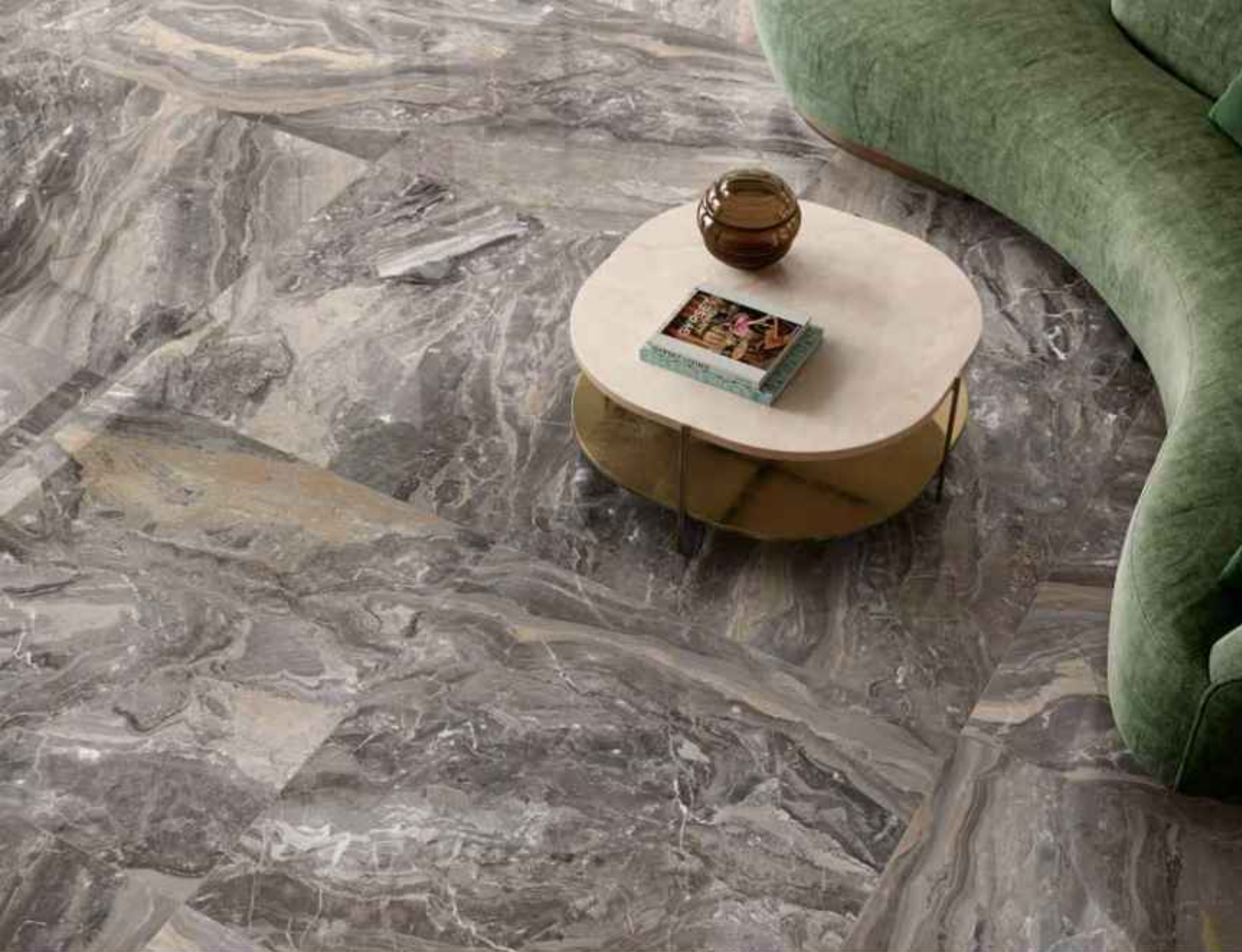
Floor: KEEN GREY 120x120 LUCIDATO RT

I cromatismi di Keen Grey richiamano antichi strati di sedimentazione, e spaziano tra i grigi e punte calde e brunito.