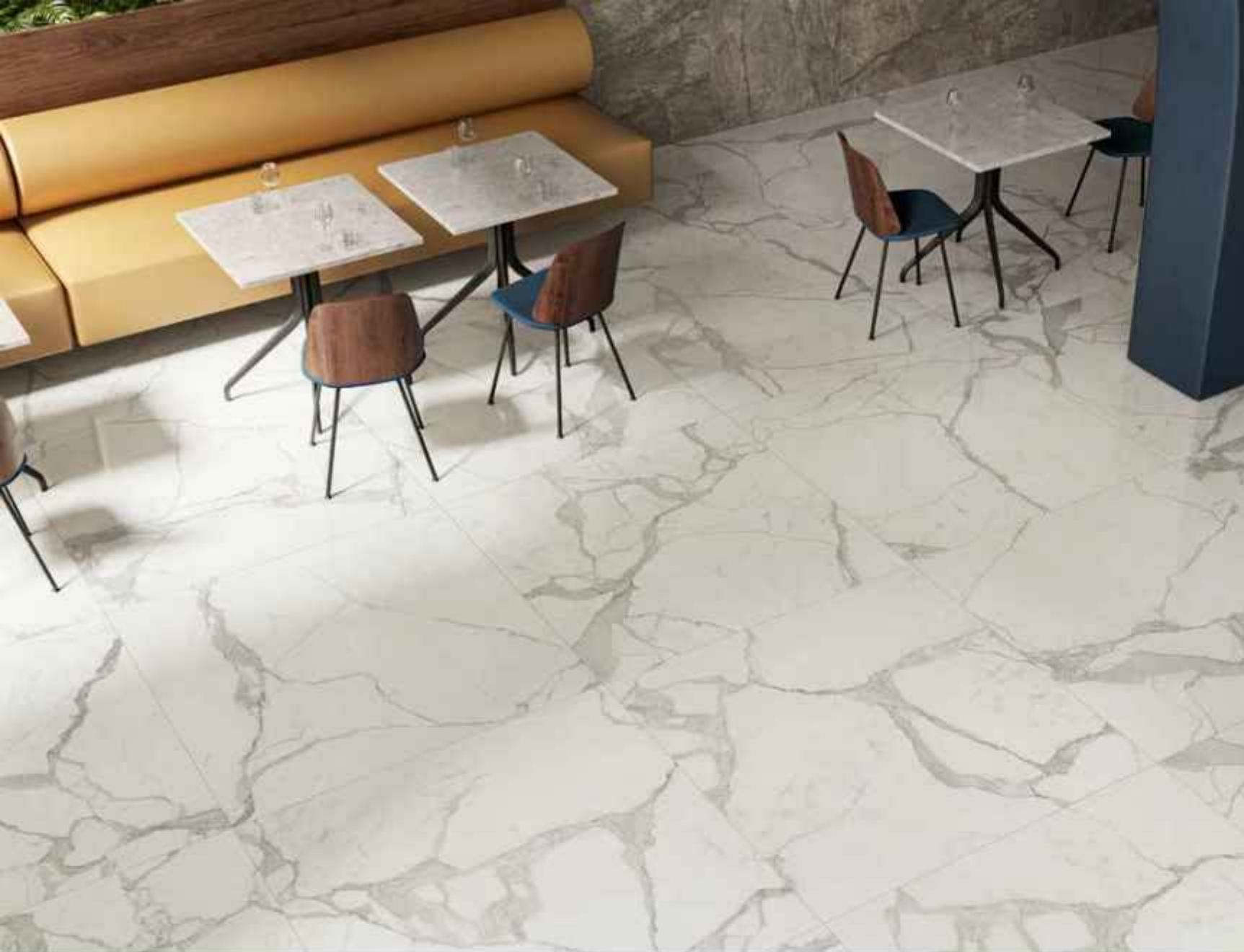
Floor: MAJESTIC WHITE 120x120 LUCIDATO RT Wall: AMAZING SILVER 80x80 LUCIDATO RT

Le nitide venature di Majestic White corrono sulla superficie e caratterizzano gli spazi con il loro fascino.