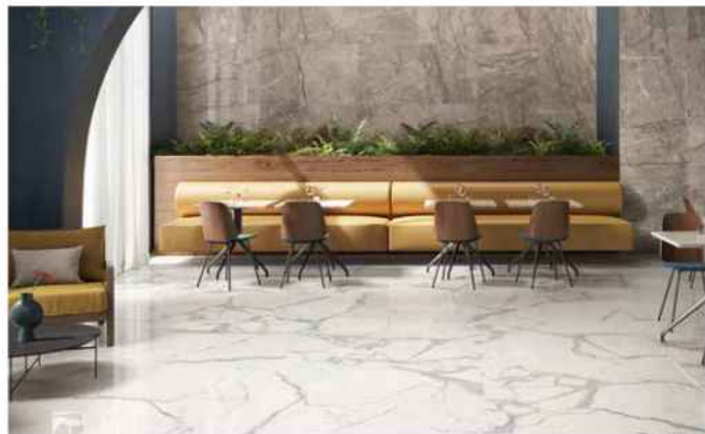
M ajestic White

Anima Futura stimuliert eine neue Wahrnehmung des Marmors, durch Kombination mit geometrischen Formen, leuchtenden Farben, schlichtem oder kostbarem Mobiliar. Und inspiriert dazu, mehrere Farben zu mixen oder auch eklektisch Materialien zu kombinieren.