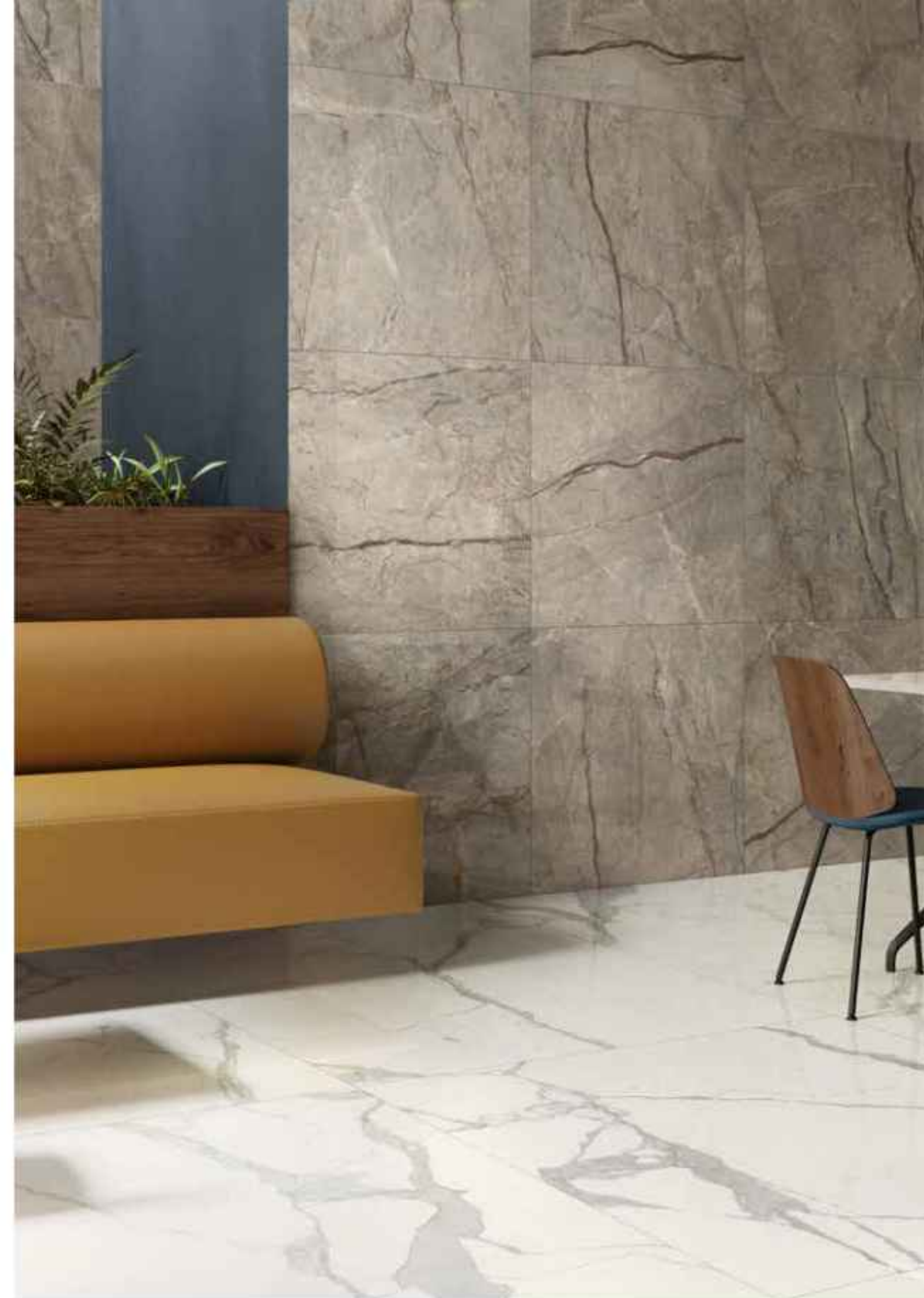
Floor: MAJESTIC WHITE 120x120 LUCIDATO RT Wall: AMAZING SILVER 80x80 LUCIDATO RT Furniture by Olo: HIKE NUANCE 20x120 MATT

Die klaren Äderungen von Majestic White verlaufen an der Oberfläche und prägen den Raum mit ihrem Zauber.