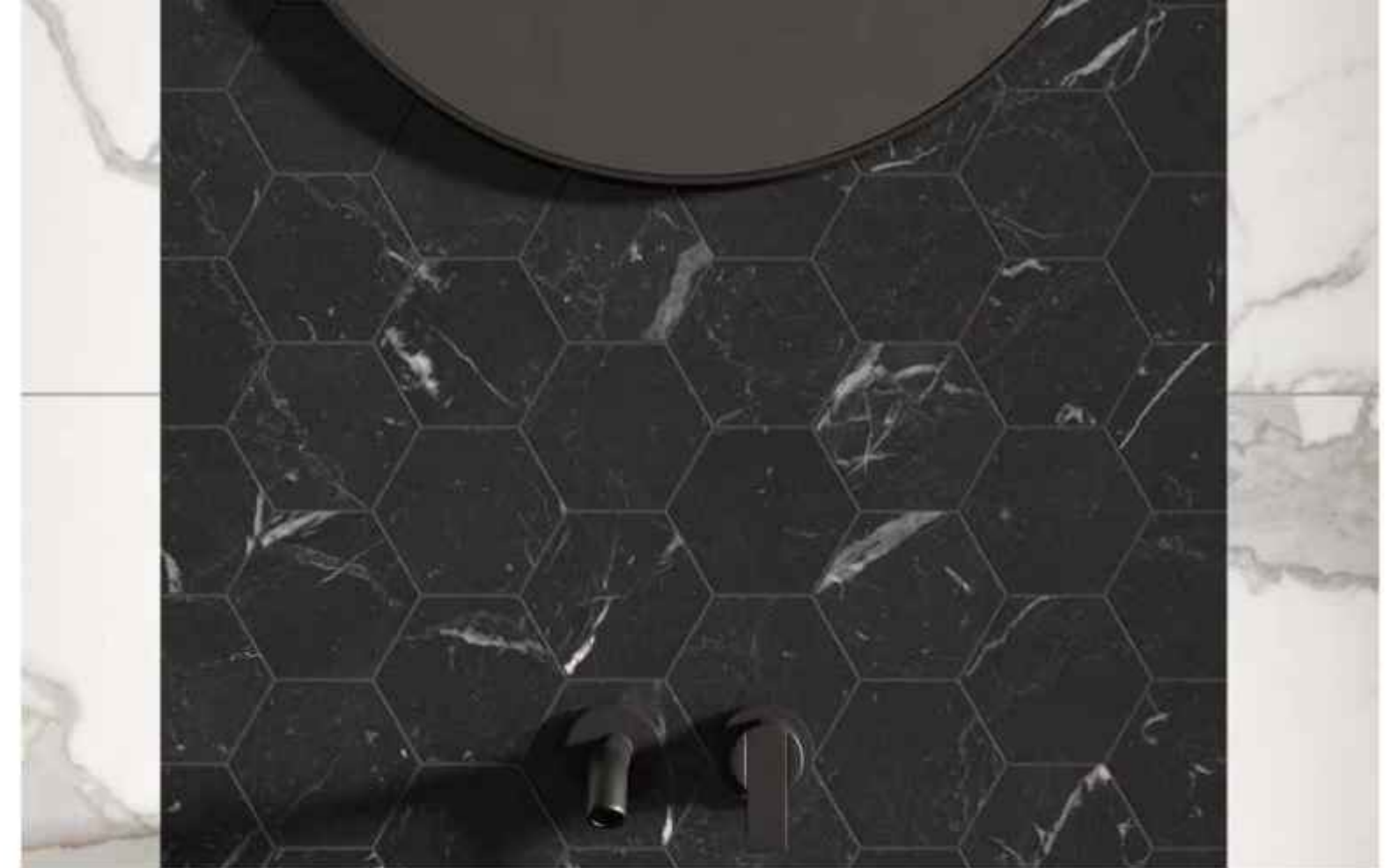
UNIQUE BLACK COMPOSIZIONE ESAGONO 28,5x33 cm - 11 15 / 16 "x 13" LUCIDATO RT