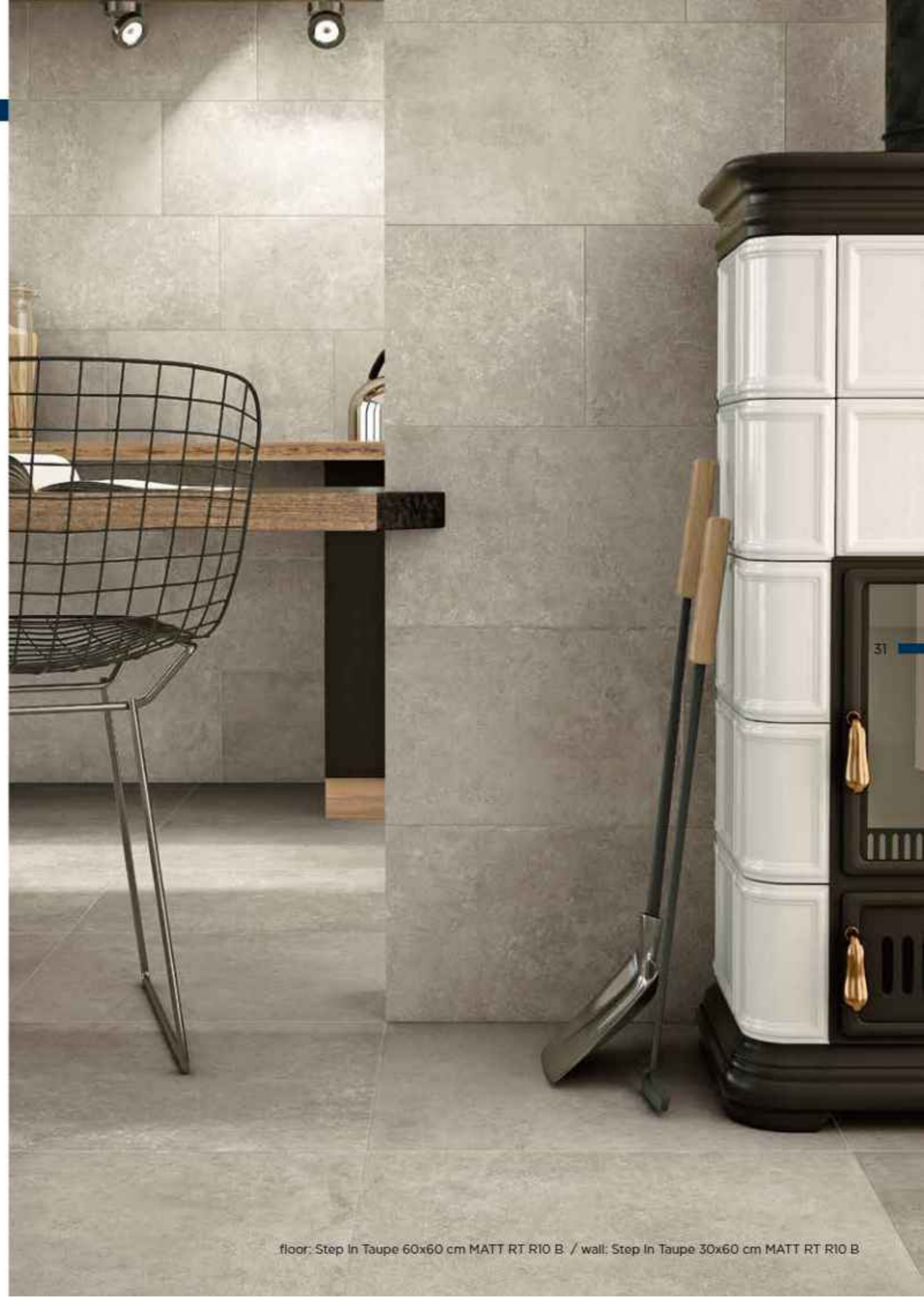
floor: Step In Taupe 60x60 cm MATT RT R10 B. / wall: Step In Taupe 30x60 cm MATT RT R10 B