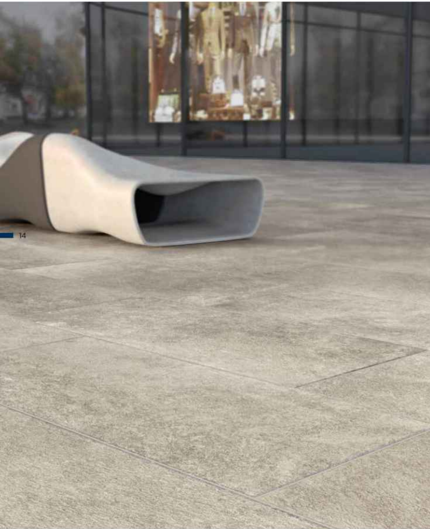
floor: Step Out Dust 30x60 cm MATT NR R11 C