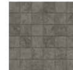
30x30 cm - 11 15/16"x11 15/16"

IMBALLI / PACKAGING / CONDITIONNEMENT / VERPACKUNGSEINHEITEN