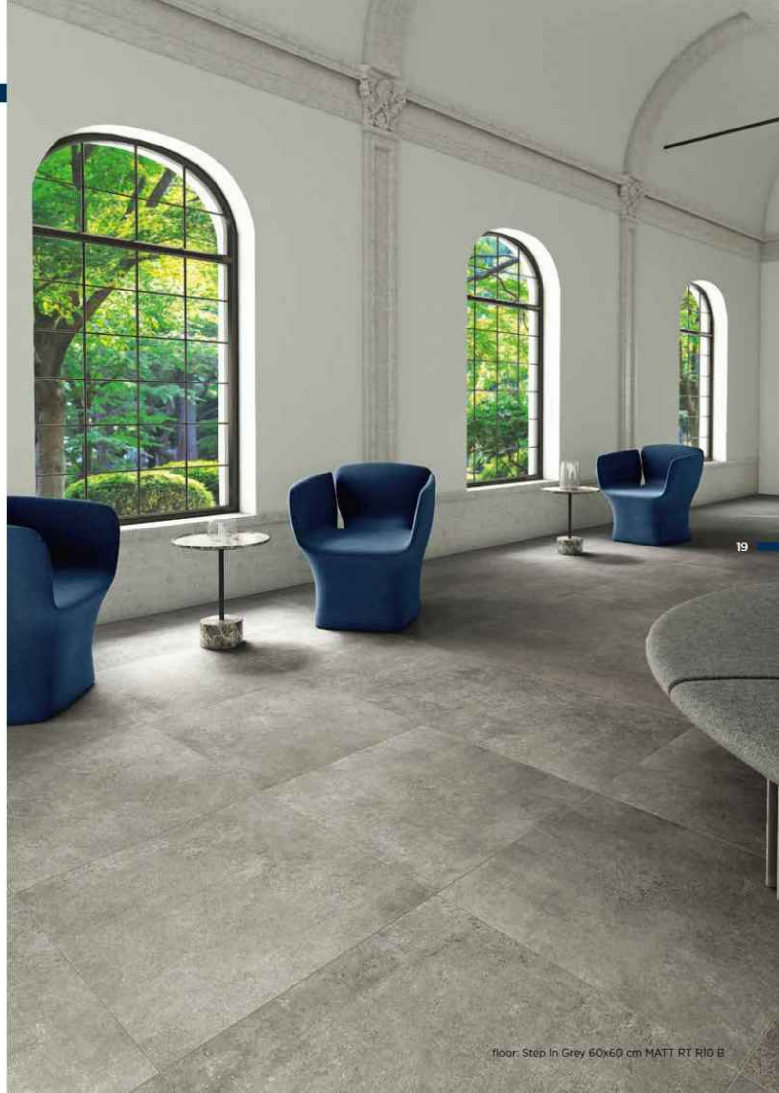
floor: Step In Grey 60x60 cm MATT RT R10 B