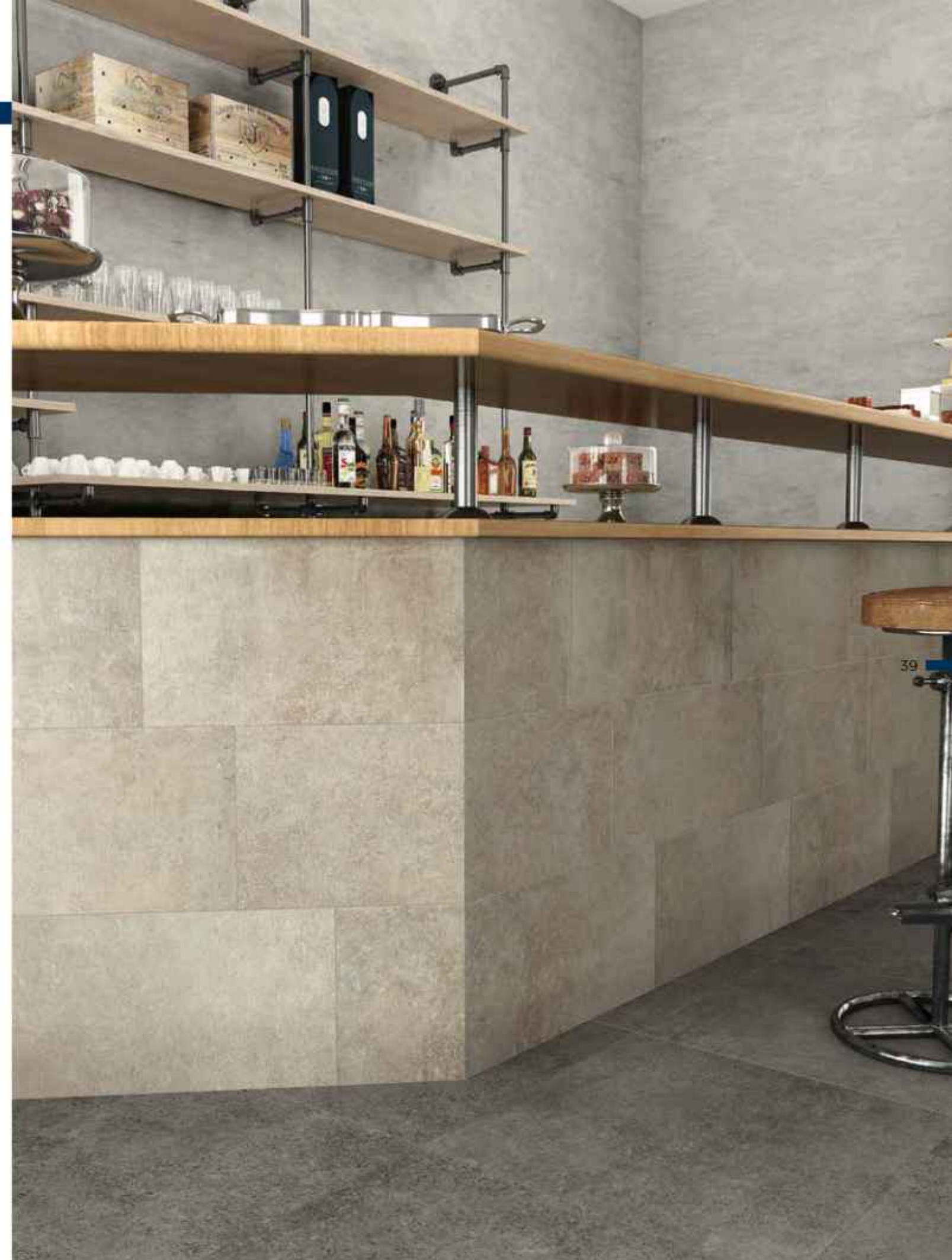
floor: Step In Dark 60x60 cm MATT RT R10 B