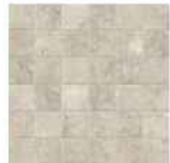
30x30 cm - 11 15/16"x11 15/16"