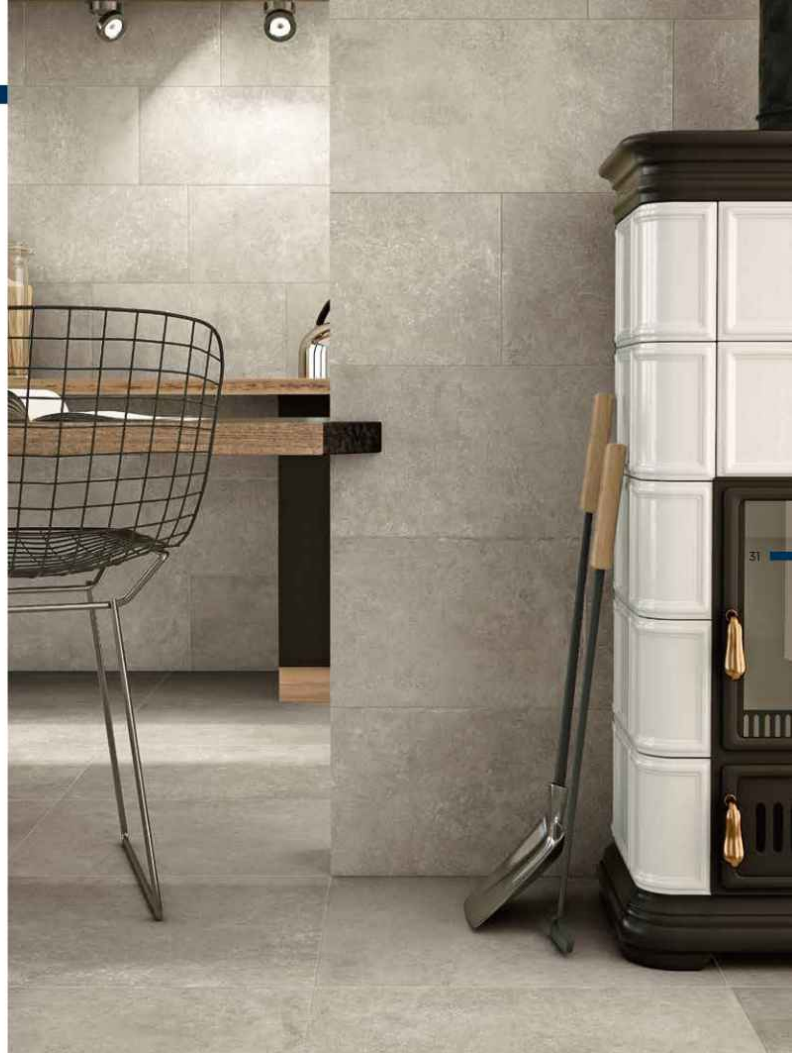
floor: Step In Taupe 60x60 cm MATT RT R10 B. / wall: Step In Taupe 30x60 cm MATT RT R10 B