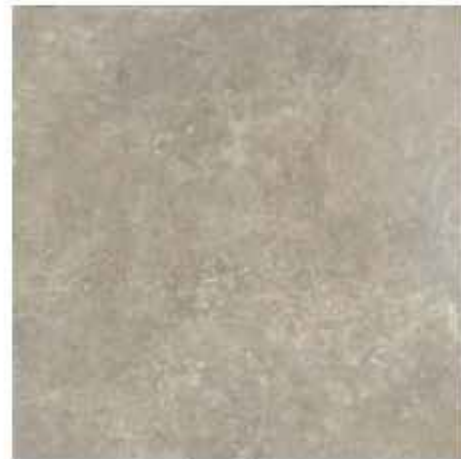
60x60 cm - 23 5/8"x23 5/8"