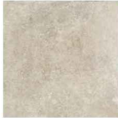
60x60 cm - 23 5/8"x23 5/8"