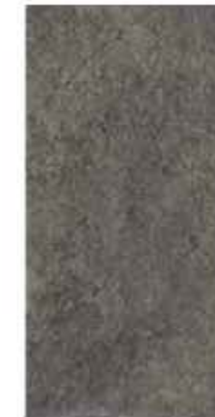
30x60 cm - 11 15/16"x23 5/8"