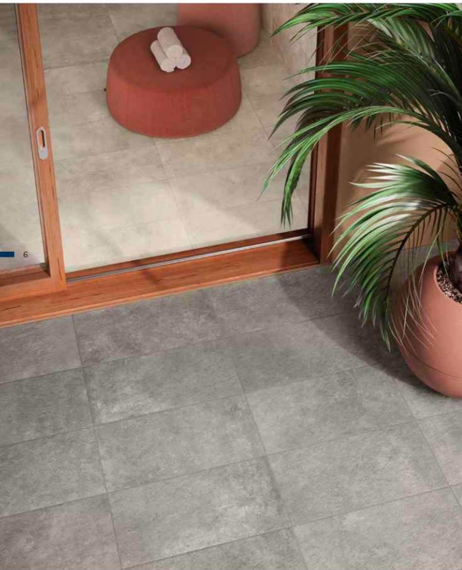
floor indoor: Step In Dust 30x60 cm MATT RT R10 B / floor outdoor: Step Out Grey 30x60 cm MATT NR R11 C