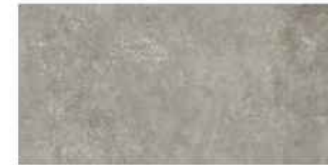
30x60 cm - 11 15/16"x23 5/8"