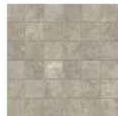
30x30 cm - 11 15/16"x11 15/16"