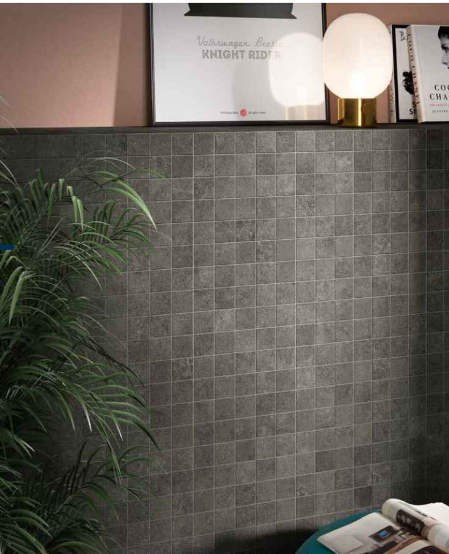
wall: composizione M Step In Dark 30x30 cm MATT