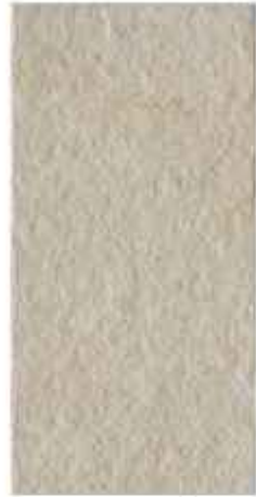
30x60 cm - 11 15/16"x23 5/8"