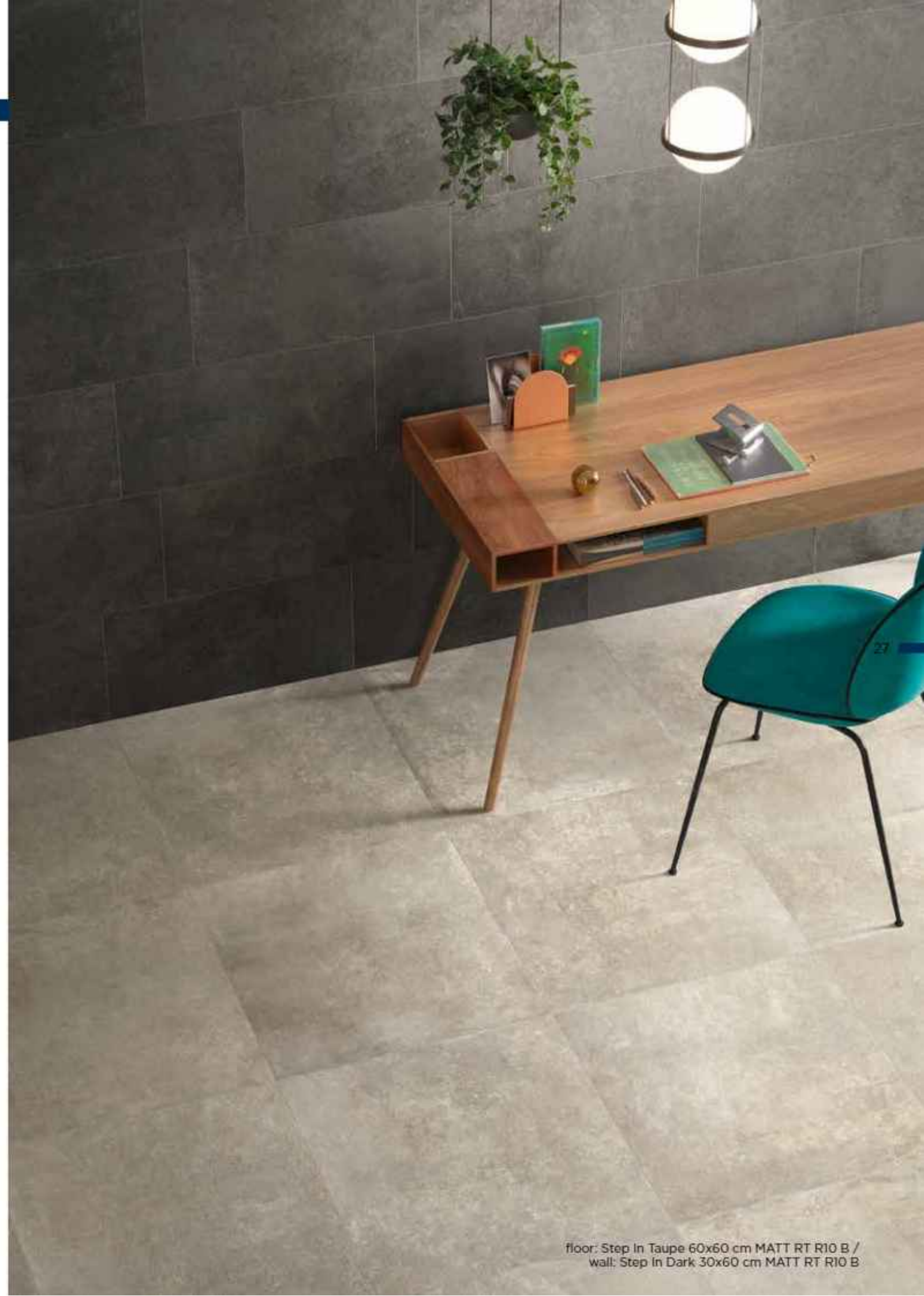
floor: Step In Taupe 60x60 cm MATT RT R10 B / wall: Step In Dark 30x60 cm MATT RT R10 B