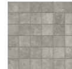
30x30 cm - 11 15/16"x11 15/16"