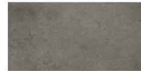
30x60 cm - 11 15/16"x23 5/8"