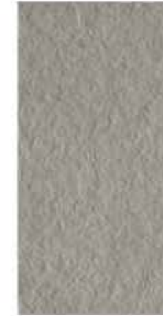
30x60 cm - 11 15/16"x23 5/8"