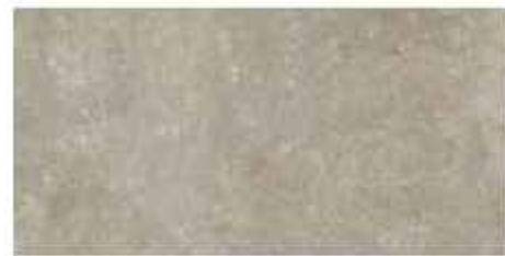
30x60 cm - 11 15/16"x23 5/8"