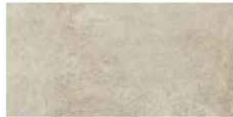
30x60 cm - 11 15/16"x23 5/8"