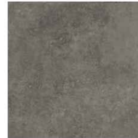
60x60 cm - 23 5/8"x23 5/8"