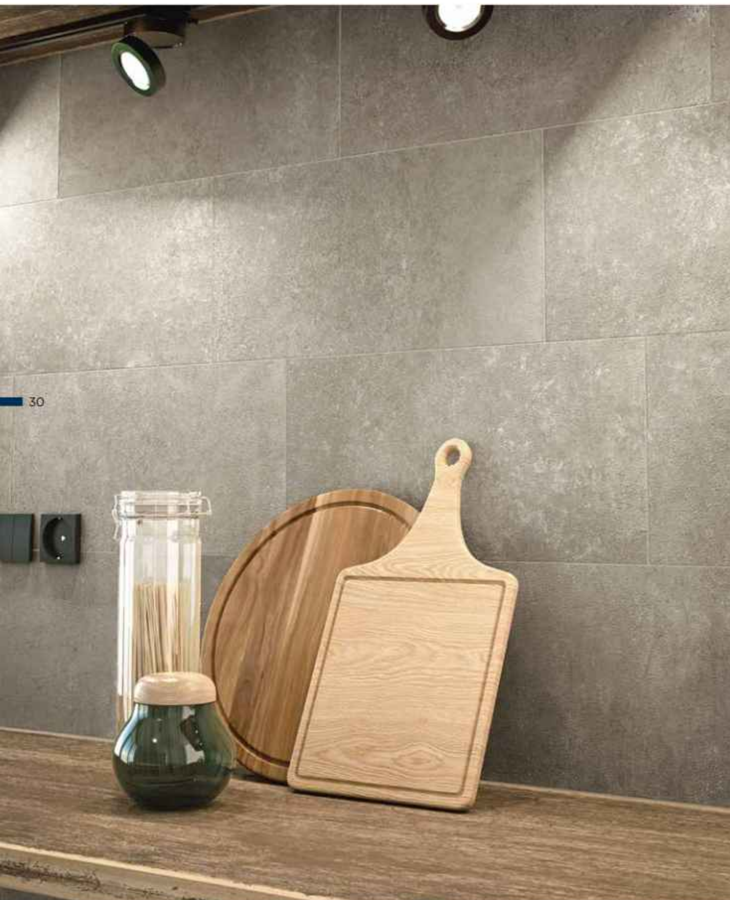
wall: Step In Taupe 30x60 cm MATT RT R10 B