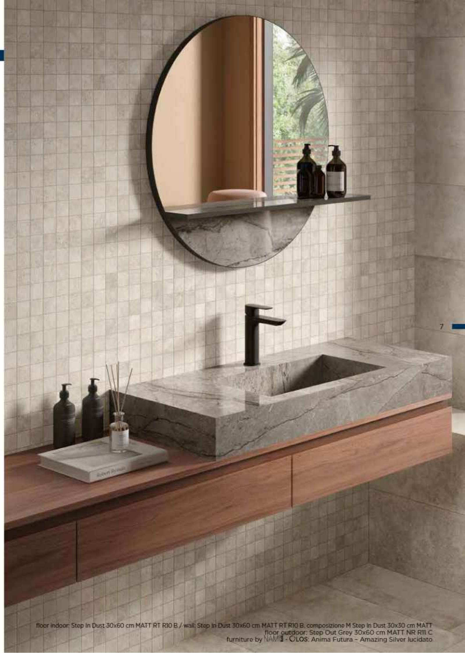
floor indoor: Step In Dust 30x60 cm MATT RT R10 B / wall: Step In-Dust 30x60 cm MATT RT R10 B; composizione M Step In Dust 30x30 cm MATT floor outdoor: Step Out Grey 30x60 cm MATT NR R11 C furniture by NAM - OLOS: Anima Futura - Amazing Silver lucidato