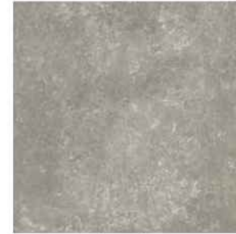
60x60 cm - 23 5/8"x23 5/8"