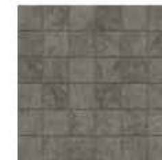
30x30 cm - 11 15/16"x11 15/16"

IMBALLI / PACKAGING / CONDITIONNEMENT / VERPACKUNGSEINHEITEN