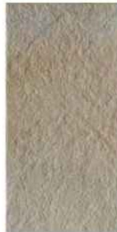
30x60 cm - 11 15/16"x23 5/8"